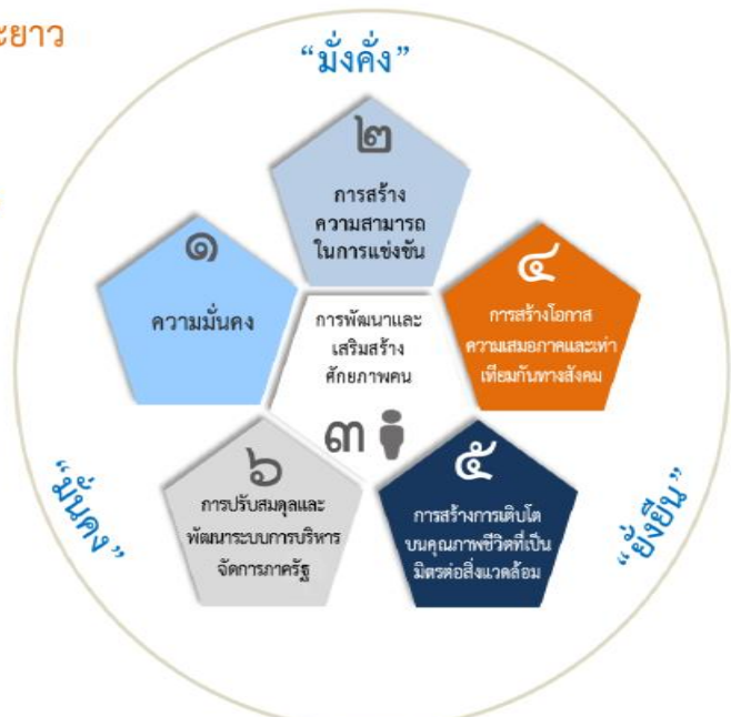
ความเชื่อมโยงของยุทธศาสตร์ชาติกับแผนในระดับต่างๆ

เพื่อให้บรรลุวิสัยทัศน์ “ประเทศไทยมีความมั่นคง มั่งคั่ง ยั่งยืน เป็นประเทศพัฒนาแล้ว ด้วยการพัฒนาตามปรัชญาของเศรษฐกิจพอเพียง” นำไปสู่การพัฒนาให้คนไทยมีความสุข และตอบสนองต่อการบรรลุ ซึ่งผลประโยชน์แห่งชาติ ในการที่จะพัฒนาคุณภาพชีวิต สร้างรายได้ระดับสูงเป็นประเทศพัฒนาแล้ว และสร้าง ความสุขของคนไทย สังคมมีความมั่นคง เสมอภาคและ เป็นธรรม ประเทศสามารถแข่งขันได้ในระบบเศรษฐกิจ